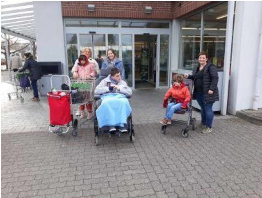
Einkauf im Aldi