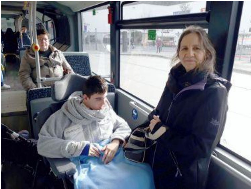
Busfahrt zum Forum