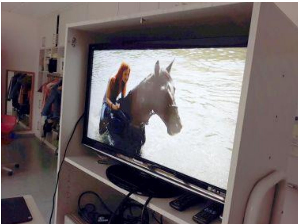
Wir schauen uns den Film Ostwind an.