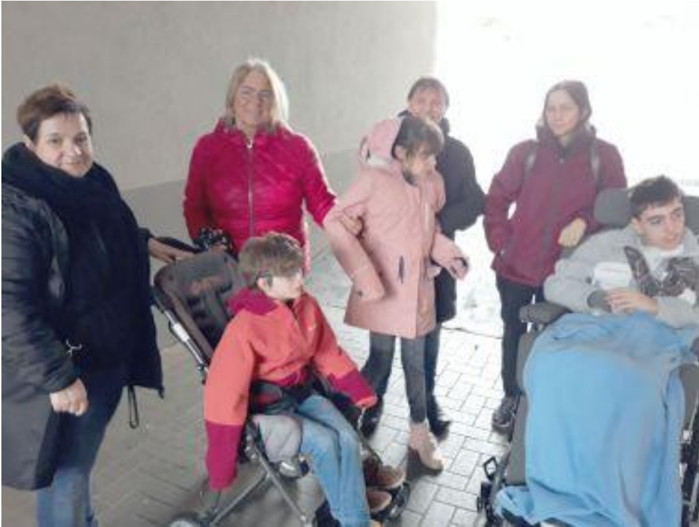
Wir besuchen unsere Praktikanten in der Lebenshilfe